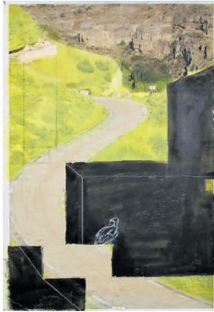
Twee van de Noticias